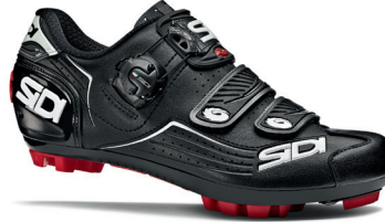
WHITE | WHITE