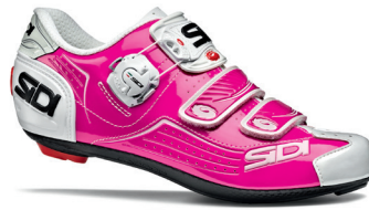
FUXIA | WHITE