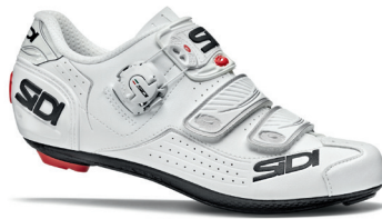
WHITE | WHITE BIANCO | BIANCO