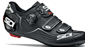
BLACK | BLACK NERO | NERO