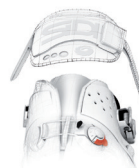
SOFT INSTEP 2

-- E' un cinturino posizionato sul collo del piede, sagomato, morbido e anatomico accoppiato con un materiale soffice per maggior comfort. Distribuisce la pressione in modo omogeneo sul collo del piede e si regola su entrambi i lati per avere una posizione perfettamente centrata del cinturino a seconda che il collo del piede sia basso o alto. Il sistema elimina la necessità di usare un distanziale. SOFT INSTEP è sostituibile.